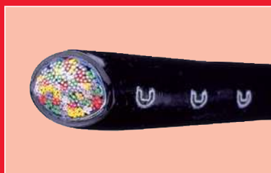
Types de câbles