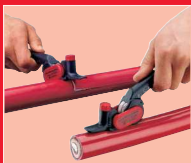
Coupe circulaire et longitudinale

Dimensions mm : 160x35x65 - Poids total 200 gr